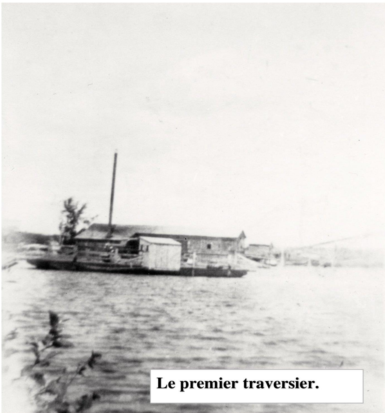
Le premier traversier.