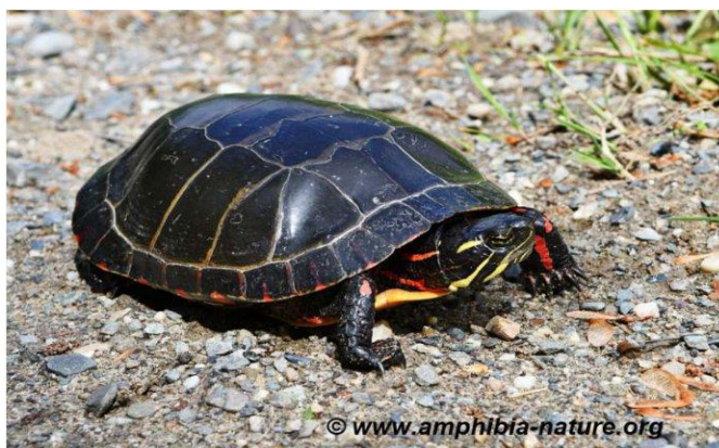
Une tortue peinte adulte observée sur le bord d'un chemin de gravier.

Vous pouvez signaler vos observations à Amphibia-Nature qui confirmera l'identification de l'espèce et pourra répondre à vos questions. Tout signalement, récent ou passé, est pertinent s'il est accompagné d'une photo, d'une date et d'un lieu d'observation. Ces données permettront d'accroître nos connaissances sur la répartition des espèces et seront utiles à des fins de conservation des habitats et de sensibilisation du public.